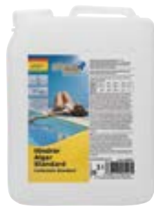
604003PP Planet Pool Hindrar Alger Standard, 3l*

Motverkar alg tillväxt förebyggande. Klorfritt och pH-neutralt, skummar inte. Användning av Planet Pool Aktivt syre ska alltid kombineras med Planet Pool Hindrar Alger Special.