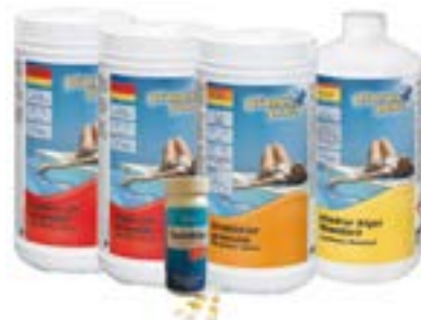
600667PP Planet Pool Startset klorfritt ▣ Aktivt syre 1 kg* ▣ Hindrar Alger Special 1 l* ▣ Höjer pH 1 kg ▣ Sänker pH 1,5 kg ▣ Teststickor