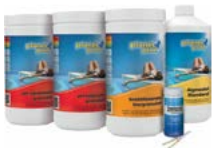
600647PP Planet Pool Startset med klor ▣ Snabbklor 1 kg ▣ Hindrar Alger Standard 1 l* ▣ Höjer pH 1 kg ▣ Sänker pH 1,5 kg ▣ Teststickor