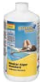
604001PP Planet Pool Hindrar Alger Standard, 1l*

För desinfektionsprodukter baserade på aktivt syre är det nödvändigt att använda Hindrar Alger för att förebygga algbildning och få desinfektion under längre tid. Algmedel är flytande och blandas ut i en hink med vatten innan de sprids ut i poolen.