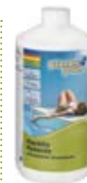
901001PP Planet Pool Flockfix flytande, 1l

Specialprodukt för bekämpning av grumligt vatten och förbättrar sandfiltrets kapacitet. Doseras långsamt i bräddavloppet eller sprids ut direkt på vattenytan. Kan användas försiktigt med patronfilter.