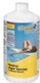
610001PP Planet Pool Hindrar Alger Special, 1l*

Motverkar alg tillväxt förebyggande. Klorfritt, pH-neutralt men svagt skummande.