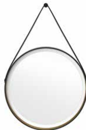
En planspegel med inbyggd led-belysning blir en trendig detalj i badrummet.