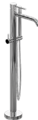
Golvblandare för badkar med engreppsfattning och handdusch.