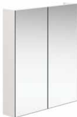
Ett spegelskåp ger bra förvaring, möjlighet att spegla sig i nacken samt kan också gömma en elkontakt.