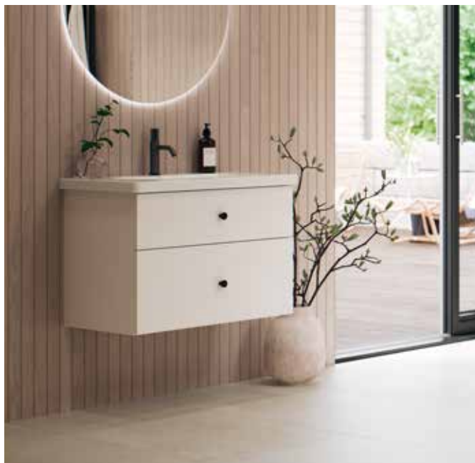
Möbel med integrerat handfat.