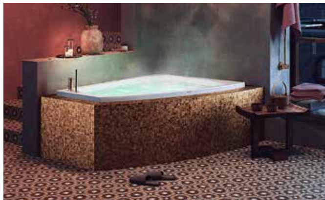
Kungshamn är ett hörnplacerat duobadkar från Nordhem med möjlighet till massagesystem och som även går att kakla in.

praktiskt om du lätt vill kunna städa under badkaret utan att ta bort fronten. Om man har väldigt liten yta men ändå vill ha in ett badkar så är ett sittbadkar en bra kompromiss. Längden är ofta mindre än 120 cm, men i gengäld brukar höjden och baddjupet vara väl tilltaget. Sittbadkaren finns både som hörnplacerade och fristående modeller.