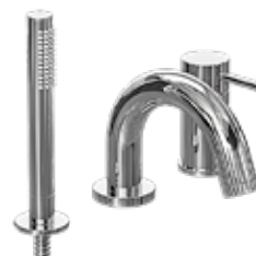
Sargblandare för badkar med engreppsfattning, handdusch och omkastare.