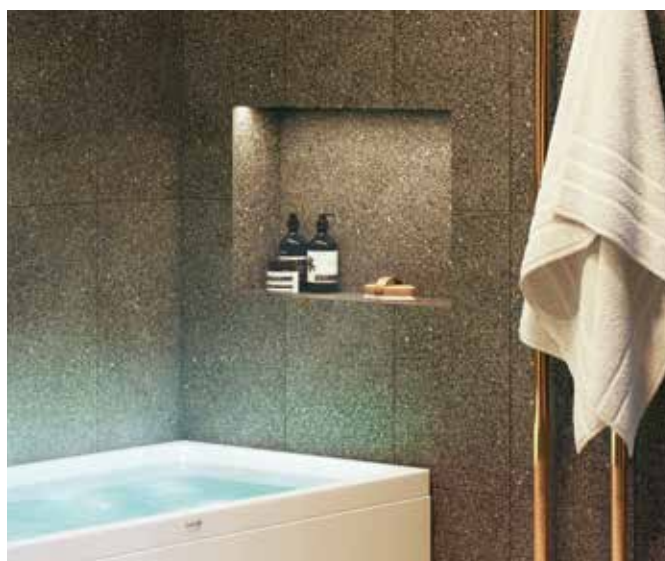
En inbyggd hylla med minispotlights ger både förvaring och mys.