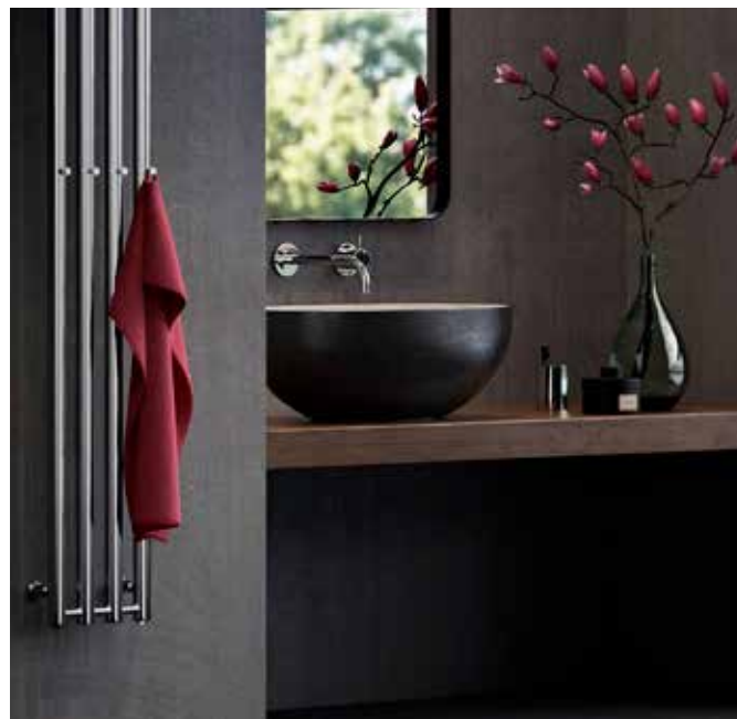
Här ett toppmonterat tvättställ ovanpå en bänkskiva.