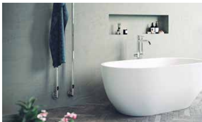
Målade betong, som på väggen här är ett alternativt ytskikt.