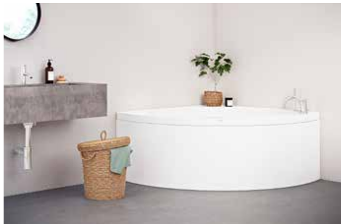
Glimminge är ett solfjäderformat badkar med möjlighet till två olika massagesystem.

kar som försetts med ett massagesystem. Det finns även fristående varianter. Förr i tiden kallades massagebadkaren för "bubbelbadkar". Det var betydligt sämre badkar, eller rättare sagt system, som snarare bubblade och väsnades mer än de faktiskt masserade. Många har kanske dåliga erfarenheter av sådana badkar. Det var inte ovanligt att smuts samlades kvar i slangarna och sprutades ut när systemet sattes igång. Även om det fortfarande finns varierande kvalitetsnivåer så är dagens massagebadkar ett lyxigt tillval. För vem vill inte kunna njuta i ett badkar med extra allt i form av ljusterapi, rygg-, fot-, botten- eller helkroppsmassage samt underhållsvärmare för riktigt långa bad? Men det är en ganska stor investering så undersök noga vad du köper.