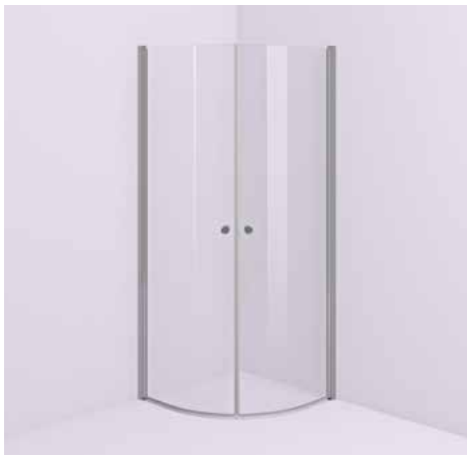
Duschvägg med två runda dörrar som går att öppna utåt och även fälla in.

Med duschen placerad i ett hörn frigörs yta och gör badrummet öppet och luftigt. Den vanligaste modellen av hörndusch är två runda eller raka duschdörrar som går att öppna utåt. Och även fälla in. En annan smart hörnduschmodell är den med vikbara dörrar som passar speciellt bra i små badrum. Storleksmässigt är en duschhörna på 90x90 cm vanligast, men många duschhörnor finns i storlekar från 70x70 cm till 100x100 cm och även i asymmetriska mått.