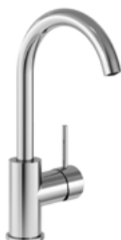
En högre blandare passar bra om man har ett toppmonterat handfat med hög kant.