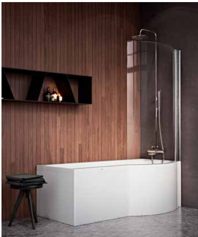
Nordhems "Solvik" är ett rektangulärt badkar med rundad duschhörna.

Massagebadkaren skulle kunna räknas som en fjärde badkarstyp, men i allmänhet är det ett hörnplacerat bad-