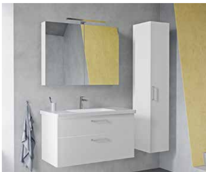
Ett kommodpaket med spegelskåp ger maximal förvaring.

Ett sista tips för förvaring är att bygga in en öppen hylla i väggen. Kan-ske även med inbyggda minispotlights? Det kan bli väldigt effektivt och skapar samtidigt extra förvaringsplats. Det är något som kan göras inne i duschen eller ovanför badkaret för att förvara diverse bad- och dusch-produkter.