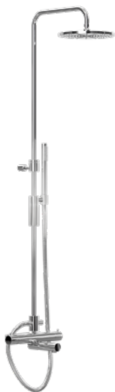
Takduschset med duschblandare, tackdusch och handdusch.

- Och om det även ska finnas ett badkar så behövs antingen en väggblandare (om blandaren ska sitta på väggen), en sargblandare om blandaren ska sitta på badkaret eller en golvblandare om den ska stå på golvet. Om du ska ha en golvblandare, tänk på att ta det med din hantverkare på ett tidigt stadie.