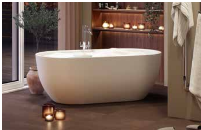
Aspholmen från Nordhem finns i två storlekar och tillverkas i akryl.