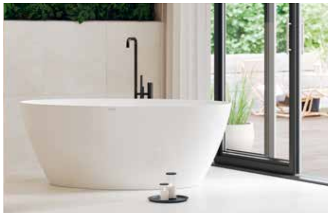
Nordhems "Ekerö" håller värmen länge och tillverkas i gjutmarmor.

många olika storlekar och i många olika material. De vanligaste materialen är akryl och gjutmarmor, det kan du läsa mer om längre fram.