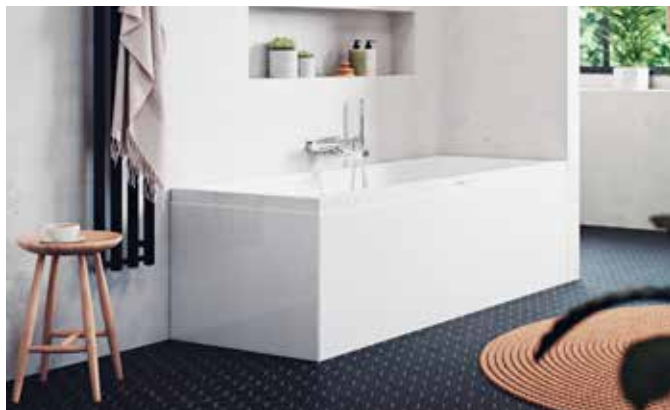
Saltholmen från Nordhem är ett flexibelt hörnbadkar som finns i sex storlekar, enkel eller dubbel rygglutning, tre olika massagesystem, underhållsvärmare, belysning med ljusterapi och tre badkarsväggar.