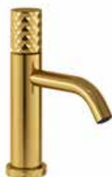
Man behöver även fundera över vilken yta samt vilken stil man vill ha på sin blandare.