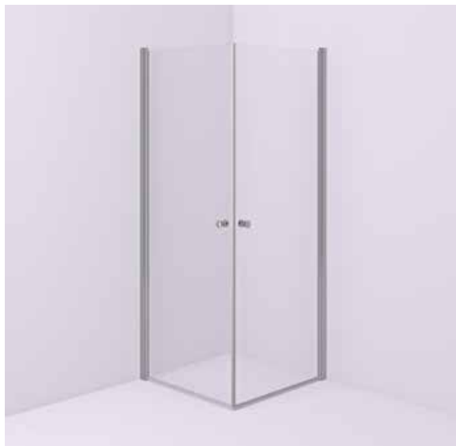
Motsvarande duschvägg fast med raka dörrar.