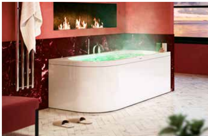
Man kan välja mellan två olika massagesystem till badkaret Torekov från Nordhem.